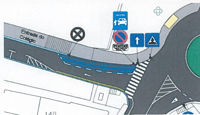
Esboço conceptual do Kiss & Ride (Travessa Manuel Alexandre)

O sucesso deste modelo assenta na colaboração de todos. Voluntarie-se e ajude a tornar o Kiss & Ride ainda mais eficiente auxiliando os alunos a sair do veículo e a entrar na escola. A segurança dos alunos é mais importante que a conveniência dos condutores. Os auxiliares estão de serviço para garantir esta segurança.